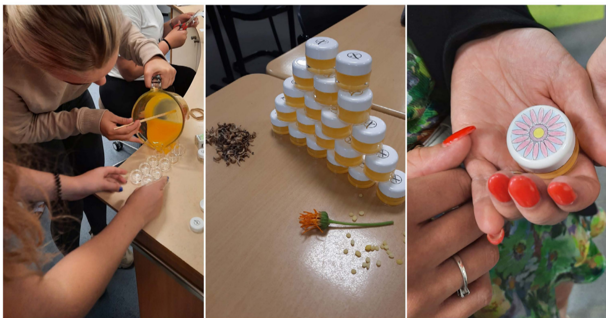
Praktijkles in actie: workshop bij de opleiding Schoonheidsverzorging (Alfa-college).

Van de goudsbloem worden vooral de bloemen gebruikt. De volledige bloem bevat meer werkzame stoffen dan alleen de bloemblaadjes. Voor de beste kwaliteit worden de bloemen geplukt bij droog en zonnig weer.